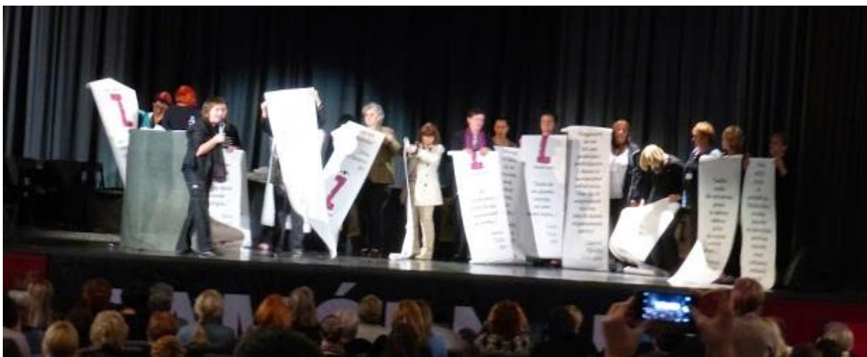
Figura 6 La chiusura del Tribunale

Insieme a tutte/i coloro che hanno ascoltato le vostre testimonianze, il Consiglio Giudiziario del Tribunale delle Donne ha udito la vostra richiesta di verità, giustizia, riparazioni e un impegno che questi crimini non ritornino più. Le raccomandazioni preliminari che seguono sono indirizzate a questo fine.