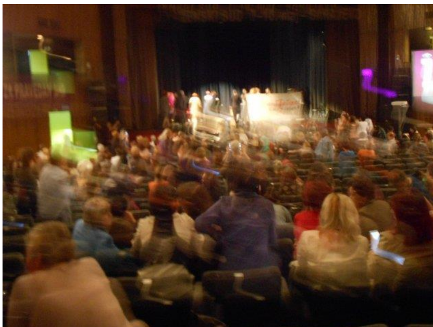
Figura 2 La sala delle udienze

I racconti si riferiscono all'attacco a Vukovar, all'assedio di Srebrenica (dal '92 al '95) e ai giorni del genocidio, alla pulizia etnica a Bratunac e Zvornik, all'arrivo di militari e paramilitari in Kosovo, alla fuga in Albania e Macedonia. Sono racconti di grandi inaspettate e spesso incomprensibili violenze (molte donne infatti segnalano che prima vivevano felicemente, condividendo festività diverse) donne che hanno perduto figli e figlie, mariti e altri familiari, casa e ogni bene, che hanno dovuto abbandonare il luogo in cui vivevano, che sono diventate profughe; donne che hanno assistito a violenze ed uccisioni, che hanno lottato per salvare i loro cari, che hanno patito la fame, hanno vissuto in condizioni impossibili in un clima di terrore; donne che incontrano i responsabili di quel che hanno subito che circolano impuniti. Donne che ancora adesso non sanno cosa è successo ai loro cari chiedono verità e giustizia (non vendetta aggiunge qualcuna), che vogliono ritrovare i resti dei loro cari ("una tomba dove piangere", "ora spero nell'apertura delle fosse comuni"). Donne che a volte vorrebbero dimenticare ("sono passati vent'anni ma sembra ieri"), ma che vogliono testimoniare ("mi sento obbligata a parlare") e ascoltare le testimonianze delle altre, di altri paesi; che vogliono raccontare perché quanto è accaduto non si ripeta perché i loro figli abbiano un futuro.