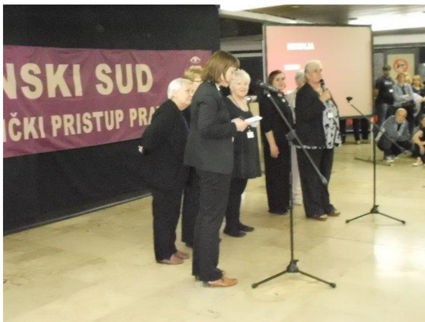
Figura 1 Apertura

In questo report non inseriamo i nomi delle testimoni, ma solo la loro provenienza.)