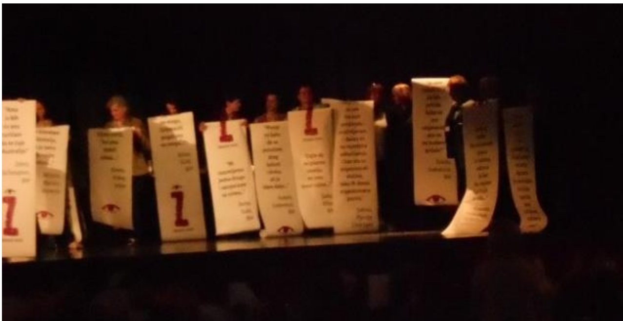
Figura 5 Sessione finale

Tutte le testimoni salgono sul palco e ad ognuna viene consegnata la striscia di carta con le sue parole; salgono anche le organizzatrici, le esperte. Tutte insieme cantano la stessa canzone bosniaca.