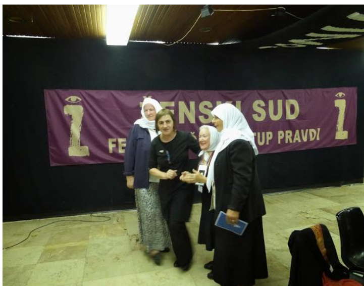
Figura 4 Le madri